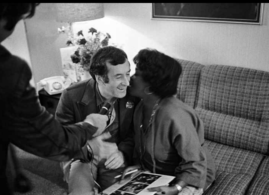
Sarah Vaughan a Luděk Hulan v šatně Lucerny, 1978