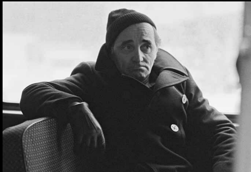
Charles Aznavour v Bratislavě, 11/1978 V mikrobuse před jediným koncertem v bývalém Československu.