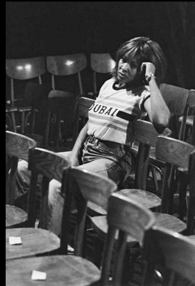
Tina Turner po zkoušce v Lucerně, 12/1981 Večer to pak rozbalila ve stříbrných šatech.