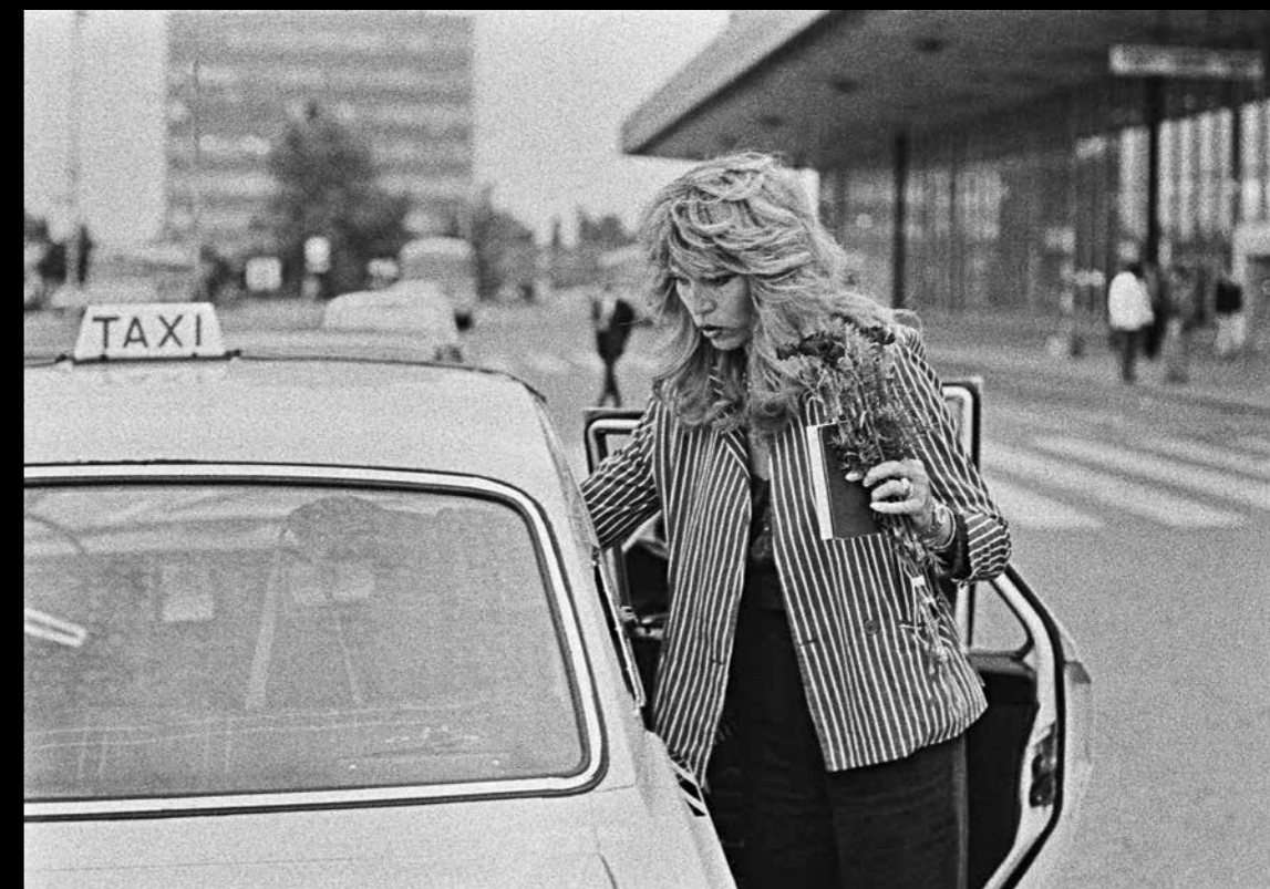
Amanda Lear po přeletu do Prahy, 05/1982