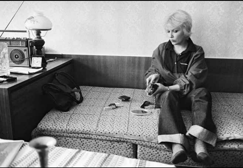
Marika Gombitová, 01/1980 A ten samý rok v zimě měla osudnou autonehodu...